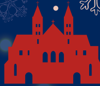
Sint Servaas basiliek